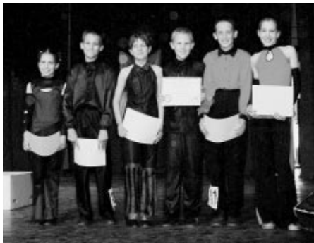
Gyermek I. kategória döntő vasvári résztvevői

A Vasvári Táncosok is a meghívottak között szerepeltek egyre szebb, egyre jobb eredményeket elérve! Közülük már 5 páros illetve 1 formáció került a fináléba!