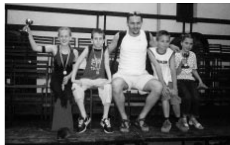
Rock and Roll siker vasvári módra