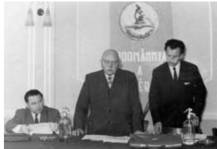
Németh Antal előadást tart a városházán

Negyven éve, 1965. szeptember 20-án, 73 éves korában hunyt el Németh Antal. A sokak által még ma is emlegetett Tóni bácsi a „múlt századi” Vasvár életének jelentős személyisége volt. A II. világháború előtt elsősorban mint újságíró, a Vasvári Újság alapító szerkesztője vált ismertté, 1945 után pedig mint a helyi múzeumügy fő pártfogója. Az 1926 és 1938 között több kevesebb rendszerességgel megjelenő helyi újságot nem csak szerkesztette, de számos cikket is írt benne, valamint tudósítója volt még több megyei és regionális újságnak is. Az 1948-ban Járdányi-Paulovics István régészeti feltárásaival megindult helytörténeti kutatások fonalát nem engedte elszakadni, kezdeményezője volt nemcsak Kádár Zoltán és Nováki Gyula további régészeti munkáinak, hanem Iványi Béla vasvári vonatkozású történeti kutatómunkájának