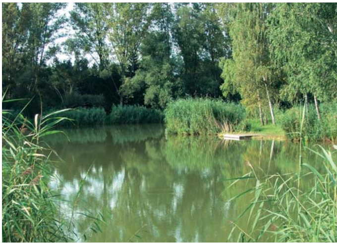
Előtte: nyári idill a régi tavon

Nincs ez másképpen – a helyi horgászok által a szezonban gyakran látogatott – vasvári Csónakázótóval sem. Ahogy jönnek a hidegek, és a halak kapókedve csökken, úgy a pecások nagy része is elmarad a vizek partjára.