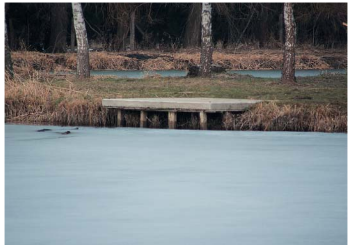
Utána : téli (rém)álmom – a víz a stég aljáig ért!

És mint ha ez nem lenne elég...! A napokban hallottam, hogy a másik, a 2-es (vagy más nevén a belső „kicsi”) tóból is elszökött a víz a jég alól! Na, ennek fele sem tréfa, gondoltam, és utánajártam az eseménynek. Meglepődve láttam, hogy a tavon a jégpáncél be van szakadva, nem bírva saját súlyát, ahogy elillant alóla a víz! Körben, a part mentén megmaradt jégből szépen látszik, hogy innen is hiányzik vagy fél méter! A készített fotókon ez nagyon jól látszik. A 2-es tó vízszintje a régi tóénál is alacsonyabb. Aztán a parton járva eljutottam a tóra szintén újonnan épített leeresztő zsilipig (lehet, hogy nem ez a szakszerű elnevezés, de mint mondtam, ebben a témában laikus vagyok). A szűk csatornában még tartja