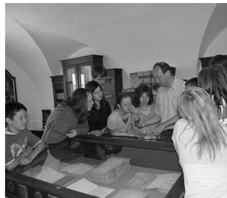
A kulturális örökség iskolája a vasvári múzeumban

A múzeum két fő profilját (megyetörténet, domonkos rendtörténet) és múzeumpedagógiai elkötelezettségét ideális módon kapcsolhatná össze az az oktatási program, amely egyelőre csak egy alkalommal, kísérleti jelleggel sikerült megvalósítani. A kulturális örök-