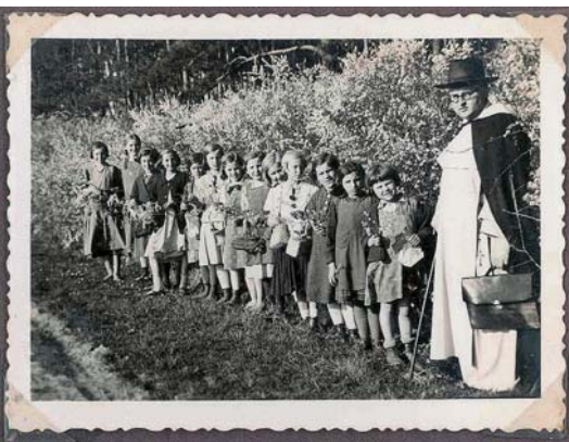
Márk Ágoston a leányiskola kisdíákjaival

visszakerül Budapestre. A későbbiekben egyik legfontosabb munkája a Credo című, ugyancsak rendi folyóirat szerkesztése. 1950-ben, közvetlenül a szerzetesrendek feloszlása előtt került ismét Vasvárra, ahol plébánosi kinevezést kapott, de munkáját éppen csak meg tudta kezdeni, 1950. június 18-án a vasvári domonkosokat is internálták; Ágoston atya előző éjszaka menekült el Vasvárról. Egy ideig fizikai munkából próbált megélni, de ezt egészségi állapota nem tette lehetővé sokáig, szociális otthonba került, élete utolsó éveit Pannohalmán, a papi otthonban töltötte. 1964-ben halt meg, végső akarata szerint Vasváron temették el a kálvária alatti domonkos kriptában.