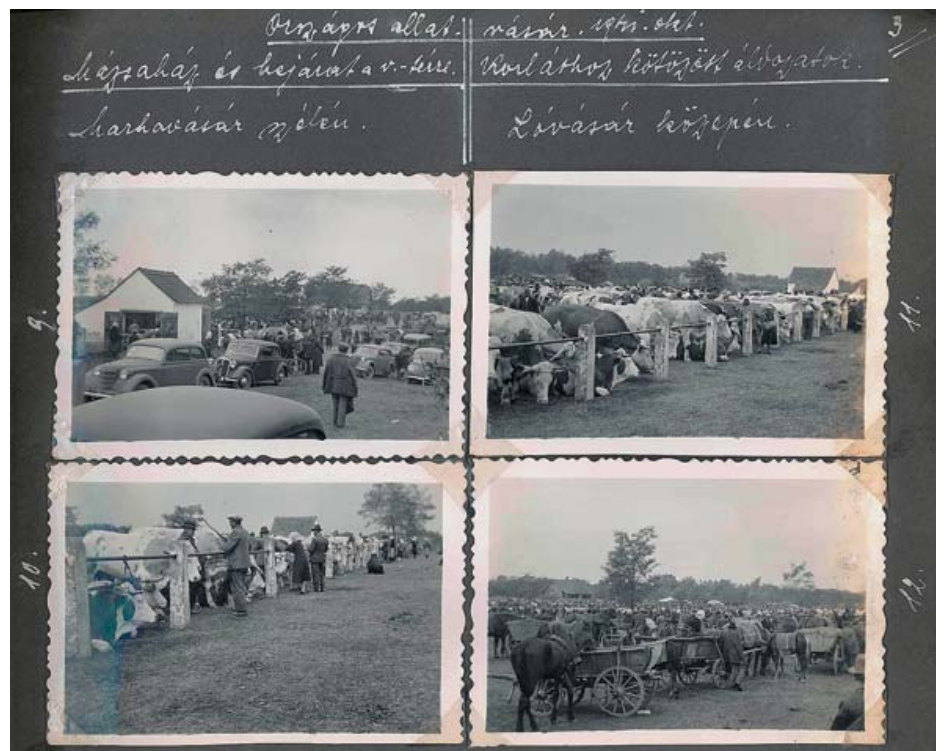
Az 1941. évi országos állatvásár