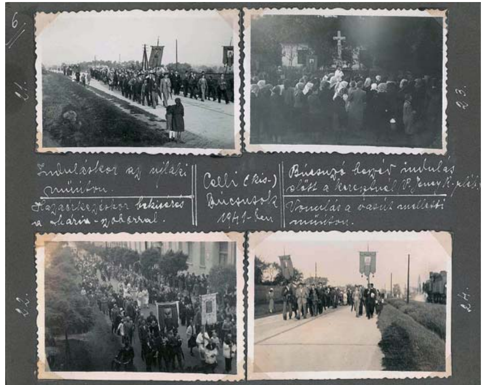
A celli búcsúok 1941-ben

séjét Vasváron mondta. Szerzetesi munkáját a rend budapesti házában kezdte, 1930-tól a Rózsafüzér Királynéja c. rendi folyóirat főszerkesztője, 1937-től Sopronban, 1938-tól Szombathelyen tevékenykedik, 1939 és 1943 között Vasváron káplán, majd ismét