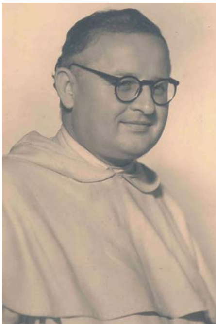
Márk Ágoston 1903–1964