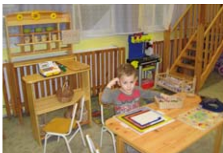
Majd csak megoldjuk valahogy!