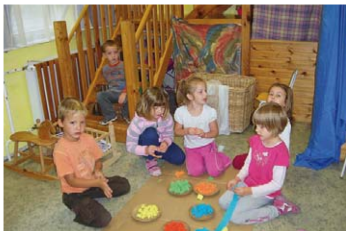
Pizzasütés Pékné módra