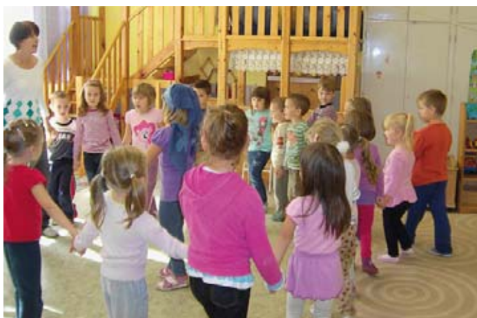
Most viszik, most viszik Uborkáné lányát