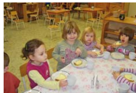
Együtt enni jó!