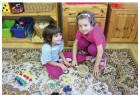
De jó az oviban!