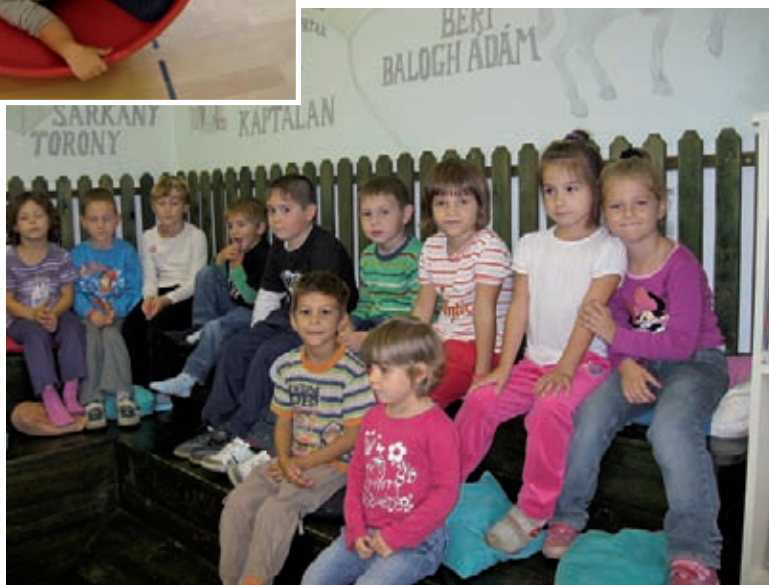
A könyvtárban jártunk