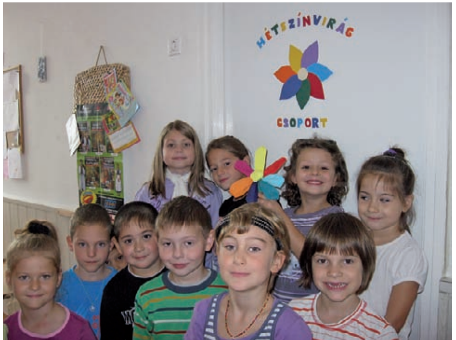
A Hétszínvirág csoport. „Egyszer volt egy szivárvány, a szivárványból lett egy virág és a szivárvány színeiből lett a neve Hétszínvirág.” (Bognár Kincső meséje)

„A játék. /Az különös./ Gömbölyű és gyönyörű” (Kosztolányi Dezső: A játék)