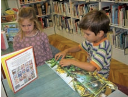
Búvárkodás a könyvek között

Hónapról hónapra képes összeállítással adunk hírt a legkisebbekről, a Ficáncoló Óvoda mindennapjairól, az intézmény „kis lakóinak” legszebb pillanatairól. Ebben a hónapban a Hétszínvirág csoport életébe nyerhetünk betekintést.