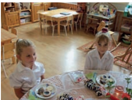
Elbúcsúztak az iskolába induló nagycsoportosok. Itt mindenki szeretettel vár benneteket, amikor csak eszetekbe jut régi ovitok!

Eztán hónapról hónapra képes összeállítással adunk hírt a legkisebbekről, a Ficánkoló Óvoda mindennapjairól, az intézmény „kis lakóinak” legszebb pillanatairól. Íme néhány pillanatsfelvétel az elmúlt hetek emlékei közül.