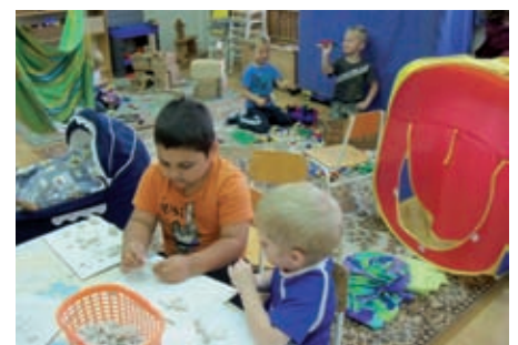
„Süssünk, süssünk valamit...”