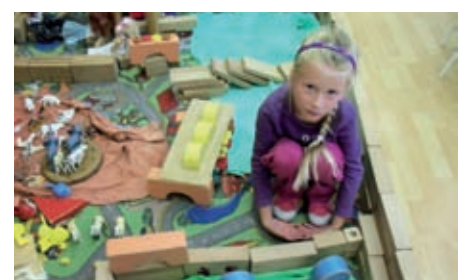
Az én házam, az én várom