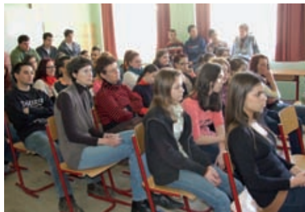
A vers örök – látható a diákok arcán is