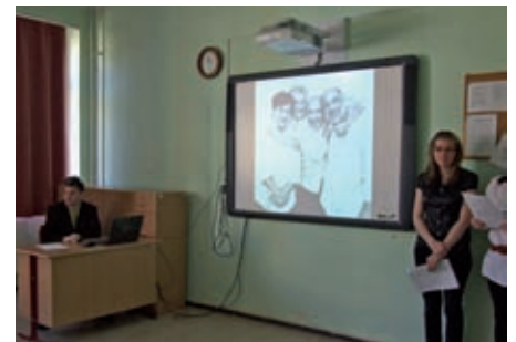
A versek zenében is megszólaltak