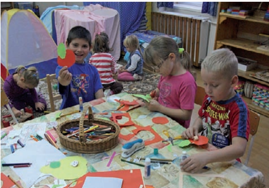
Édes almát tessék!