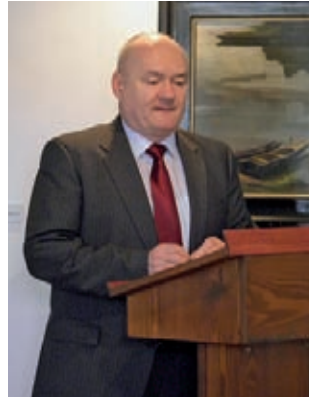
Dr. Hende Csaba

tonák az ENSZ égisze alatt békefenntartásban Vietnamban, 1996-ban aztán a daytoni béke-megállapodás betartatására indított IFOR-misszióban vett részt Magyarország Bosznia-Hercegovinában. Kiemelte: Magyarország történelme során megtapasztalhatta, hogy (a tatárjárást leszámítva) az igazi nagy biztonsági kihívások és fenyegetések mindig délről fenyegették az országot. S ráadásul ez az a határszakasz, amelyet még a Kárpátok áthatolhatatlan hegygerincei sem védenek. Nincs ez másképp napjainkban sem. A nyugat-balkáni térség stabilitása Magyarország elsőrendű politikai és biztonsági érdeke, hiszen a Balkánon zajló változó intenzitású konfliktusok hatása nálunk közvetlenül érezhető, elsőként minket sújt. Hozzátette: 2003 óta magas intenzitású konfliktusban is részt vesznek a magyar katonák. Ennek oka, hogy hazánk biztonsága messze határainkon túl kezdődik. A 2001. szeptember 11-i New York-i terrortámadás óta a világ biztonsága megváltozott, a kihívások is globalizálódtak. A mai közlekedési és hírközlési viszonyok mellett immár nem a szomszédos államok fenyegetik valamely ország biztonságát, hanem sokkal távolabbról is indulhatnak ezek a fenyegetések. Hangsúlyozta: jelenleg is 1100 magyar katonát teljesít szolgálatot békefenntartóként a világ tíz különböző pontján. Ezekben a műveletekben a magyar katonák kiemelkedően teljesítenek – hangzott el.