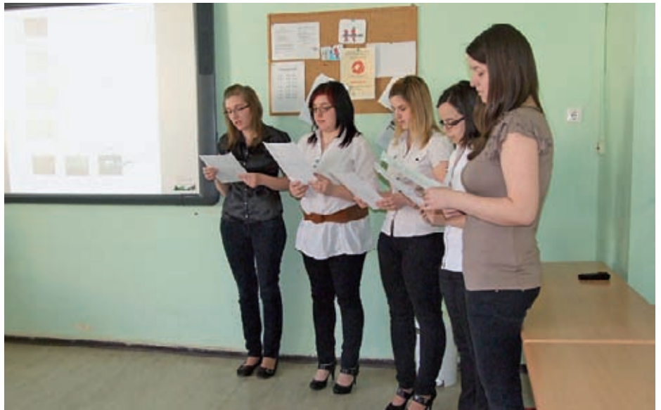
A költészet napján a 14. évfolyamosok emlékeztek József Attilára

A vasvári középiskolában folyik a diákok önkéntes munkájának szervezése. Szeretnénk, ha Vasváron tudnák a diákok teljesíteni a szolgálatot. Partnereink a programban a városi könyvtár, a kulturális központ, az Idősek Otthona és a katasztrófavédelem. A koordinálásban segítséget nyújt a Vasi Diák Közösségi Szolgálat is.