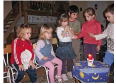
Ég a gyertya ég