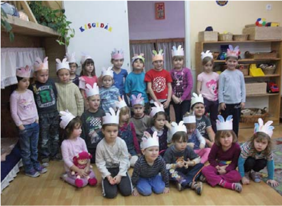
Bemutkozik a Kisgida-csoport