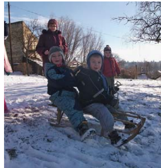
Végre lehet szánkózni!