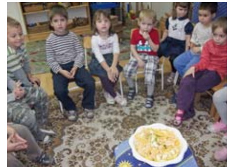
Beszélgetés az egészséges táplálkozásról