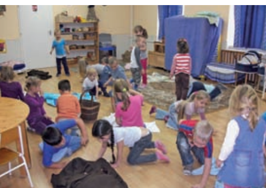
Csiribi-csiribá, változzunk át süncsaláddá!