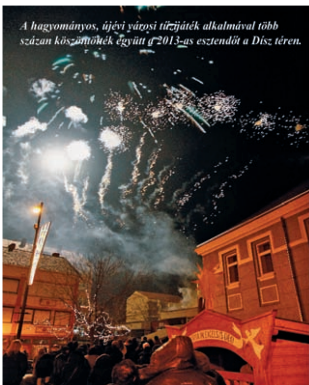
A hagyományos, újévi városi tűzijáték alkalmával több százán köszöntőjük együtt a 2013-as esztendőt a Dísz téren.

A Paktum a Nagy Gáspár Kulturális Központtal közös szervezésében hívja életre január 16-án, szerdán 10–12 óráig a Nagy Gáspár Kulturális Központ előterében a Fiala Álláskereső Klubját, valamint január 23-án, szerdán 10–12 óráig ugyancsak a Nagy Gáspár Kulturális Központ előterében az Állásklubot, melyre az állást keresőket, állást változtatni szándékozókat várják a szervezők.