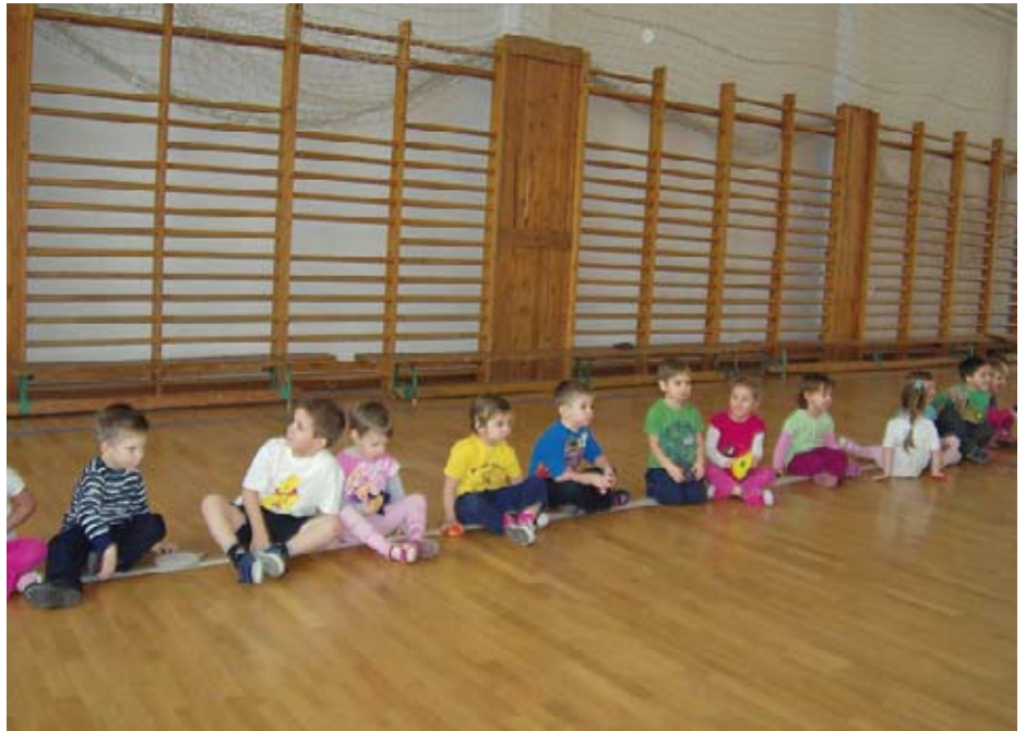
Fecskék a dróton