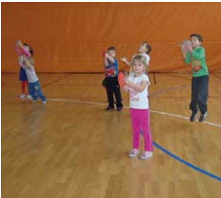
A Süni-csoportosok az iskola tornatermében