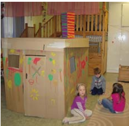
Jókorra házat építettünk!