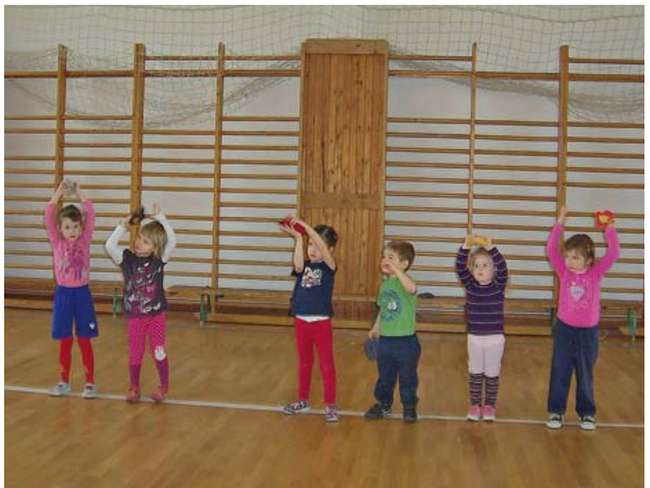
Jó magasra emeltük a babzsákok!