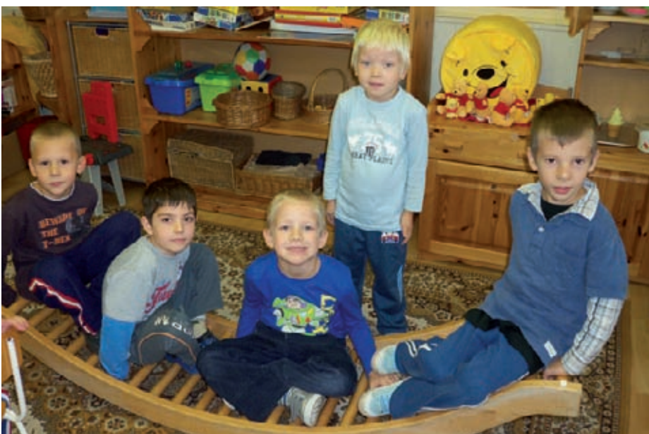
„Ültem ringó kis ladikon”