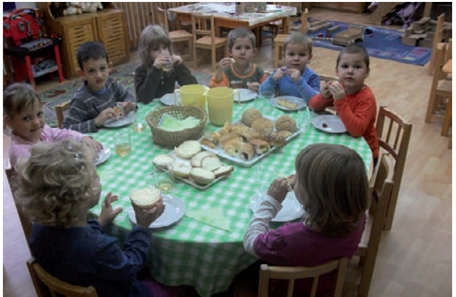
Köszönjük a Fincsi Pékség ízletes adományát!