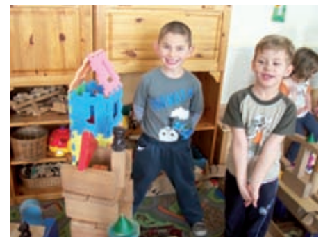
Ez a mi tornyunk!