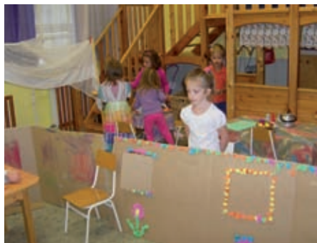
Ki jön hozzám vendégségbe?