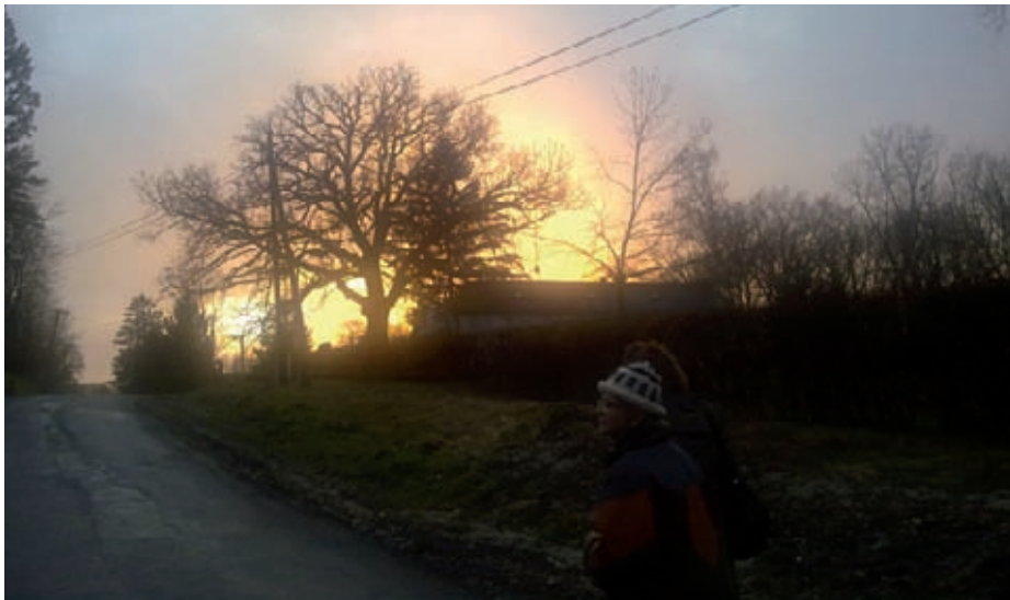
A fa „koronájával”

Túrte a mundér színét, legyen viselője labanc, a német vagy az orosz. Túrte az eszméket, mert tudta, elszállnak azok a széllel, ahogy jönnek, úgy mennek, mint ősszel az elsárgult levelei. Túrte volna a belevésett vallomásokat, hogy begyógyult hegeivel hirdethesse boldogságát az embernek. De e helyett a Rákosi-rendszer fekete dicsősége és szegységtáblájának irtóztató szege írta rá a történelmet. Sebaj, ágaival integetett bú-