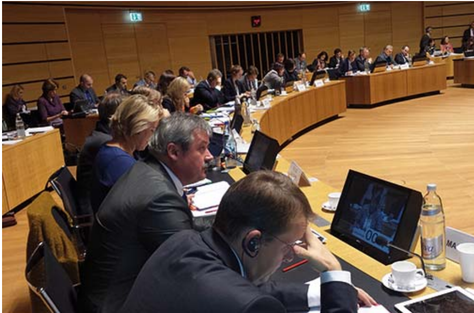
Magyarország képviselőjében Luxemburgban, a Környezetvédelmi Tanács ülésén

A kormányzati szerepköröm is jelentősen módosult. Az európai uniós támogatások feletti rendelkezés a Miniszterelnökséghez került, de a Vidékfejlesztés Program agrártárcán belüli feladatait az élelmiszeripar, az állattartás területén a mi államtitkárságunk