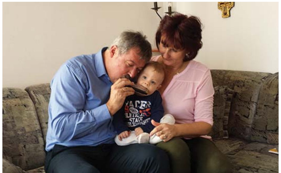
„Két száj” a szájharmonikán

szervezetekkel együttműködve, a vidéki ember természet iránti érzékenységgel, de a műszaki értelmiség racionalizmusával ellátni. Mindemellett különleges adomány, hogy a vidékfejlesztéshez és a Nemzeti Parkokhoz egyaránt ezer szállal kötődő hungarikumokkal is foglalkozhatom.