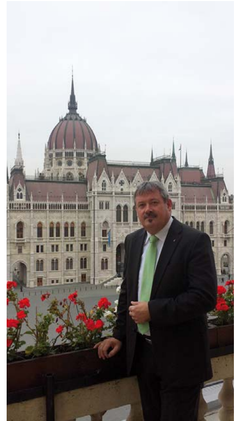
Az ország legszebb panorámájú munkahelyén

– Az idei esztendő több szempontból jelentős változásokat hozott az Ön és családja életében. Először nézzük a politikusi pályáját, hiszen megváltozott mind a képviselői, mind a kormányzati munkában betöltött szerepe. Áprilisban az országban az egyik legmagasabb választási sikert könyvelhette el ismét. A bizalom mellé nyilván magasabb fokú elvárások is társulnak mind a választók, mind a kormányfő részéről. Melyek azok a változások melyek a választókerületben, és a minisztériumban végzett munkáját meghatározzák?