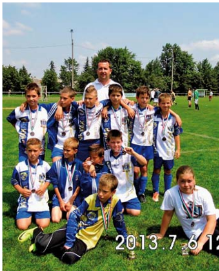
Az utánpótlásról folyamatosan gondoskodik Vasvár csapata