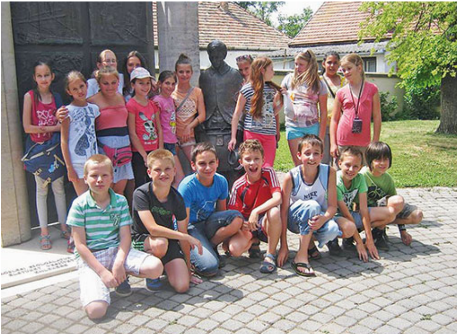
Balatonszemesen a 4. évfolyam tábora

rándulást Tihanyba, hiszen sokan most ültek először hajón, félszigetet pedig csak a térképen láttak. A mólótól gyalogosan mentek fel az Apátsági templomhoz és a gyönyörű kilátás mindenkit kárpótolt a fáradságos úttól. A levendulával szinte mindenütt, még