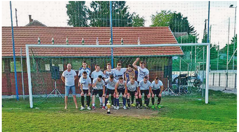
A felvétel a bajnoki cím avatásán készült: Vasvár–Szentgotthárd 19–1

Célkitűzésünk a korcsoporttal szemben – kimondva, kimondatlanul – az 1–2. hely valamelyikének megszerzése, és ezzel folyamatos 7 évesre duzzasztva a megyedöntős részvételünk (ebből 3 bajnoki cím, 4 ezüstérem). Aki nincs képen a