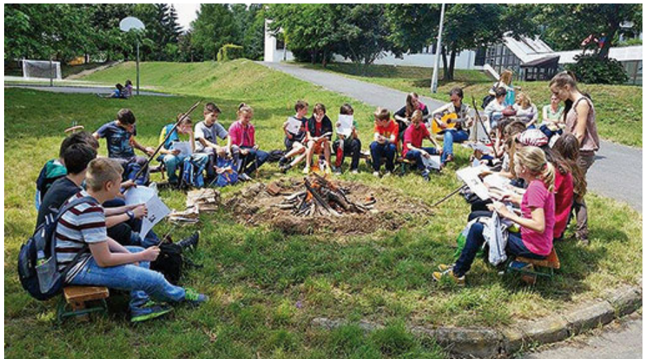
Felső tehetséggondozó tábor: szalonnasütésre várva

Balatonszemesen a Postamúzeumba látogattak el, ahol a régi postakocsik, képeslapok mellett örömmel fedezték fel a vendégeknyvből nagyobb testvérek, ismerősök aláírását, akik néhány évvel ezelőtt vettek részt ilyen táborban. Balatonszárszóra vo-