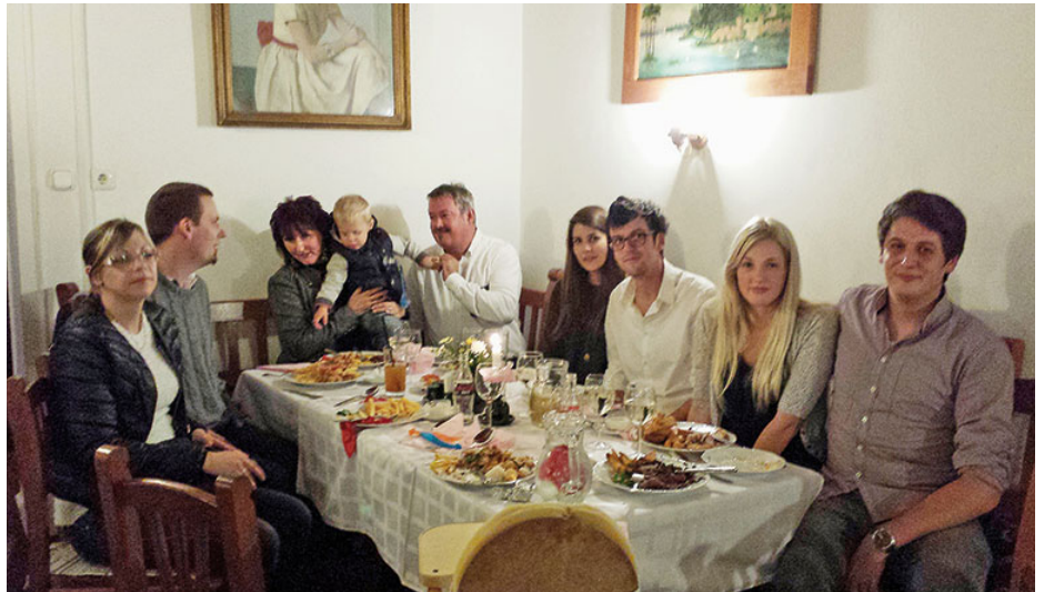
A kibővített nagycsalád a 31. házassági évfordulón

a település pályázatait. Befolyásom van a várost és a térséget érintő állami fejlesztésekre, így akár a Vasváron belüli állami utak felújítására. Nagy sikerként könyvelhetjük el, hogy az M9-es autópálya terve szerint Zalaegerszeg, illetve Szombathely irányába egyszerre két nagyváros agglomerációjába helyezi el a várost. Amikor megvalósul az M8-as és az M9-es Vasvár mellett tervezett kereszteződése, Európa valamennyi térképére jelentős csomópontként fog felkerülni.