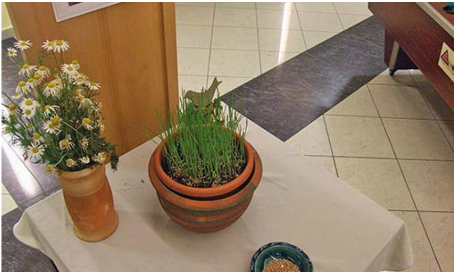
Kikelt a színházbarátok által ültetett búza