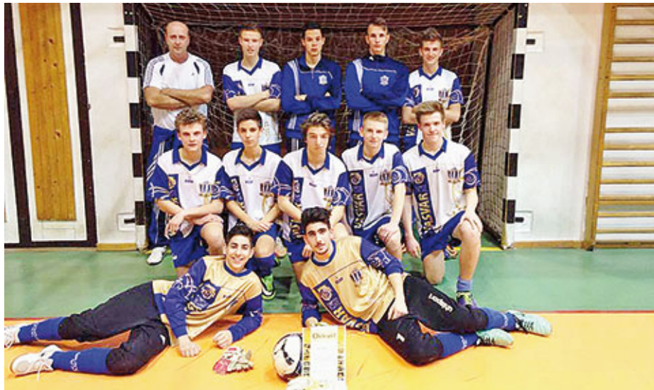
Az U-18-as csapat – a zalaegerszegi teremtorna győztesei