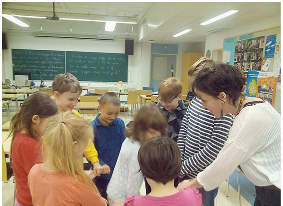
Magyaróra Tampere városban

órák anyanyelvi óráként szerepelnek a rendszerben, azonban azt tudni kell, hogy ezeken az órákon nem csupán magyar nyelvoktatás folyik, hanem a nyelvhez elválaszthatatlanul kapcsolódó kultúra, történelem, földrajz. Néprajzos ismeretek tanítását nem csak az órák keretében, de külön gyerekfoglalkozáson is szerettem volna megvalósítani. Valamint maga a finn iskolarendszerbe való betekintés, annak gyakorlatban történő vizsgálata is célom volt.