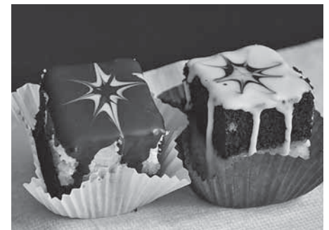
A jubileumi sütemény, a „dominikáner”

bíboros, esztergom-budapesti érsek. A két konferencián közel harminc előadás hangzott el, amelyek természetesen nyomtatott formában is meg fognak jelenni. A vasvári gyűjtemény mindkét tudományos program szervezésében aktív szerepet vállalt, és ter-