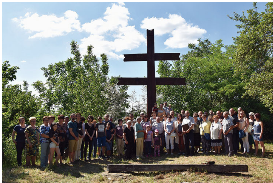
A városnéző séta résztvevői a Millenniumi Emlékkeresztnél

Laki László képgalériája a vasvar.hu -n tekinthető meg.