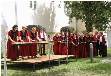
Laki László képgalériái a vasvar.hu -n láthatók