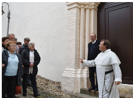
A séta egyik állomása: a templom újonnan megnyitott középkori kapuja

A múzeumigazgató a templom külsejét bemutatva elmondta, hogy nem egy szokványos középkori templommal büszkélkedhet