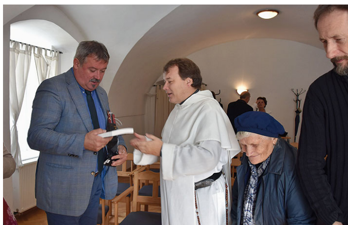
András atya a könyvbemutatón V. Németh Zsolt államtitkár úrral

A kolostor alatt lévő pincék sejtelmes világából csak ízelítőt kaphattunk, de talán az is elegendő volt az érdeklődés felcsigázásához, hogy bekukucskálhattunk az egykori kolosto-