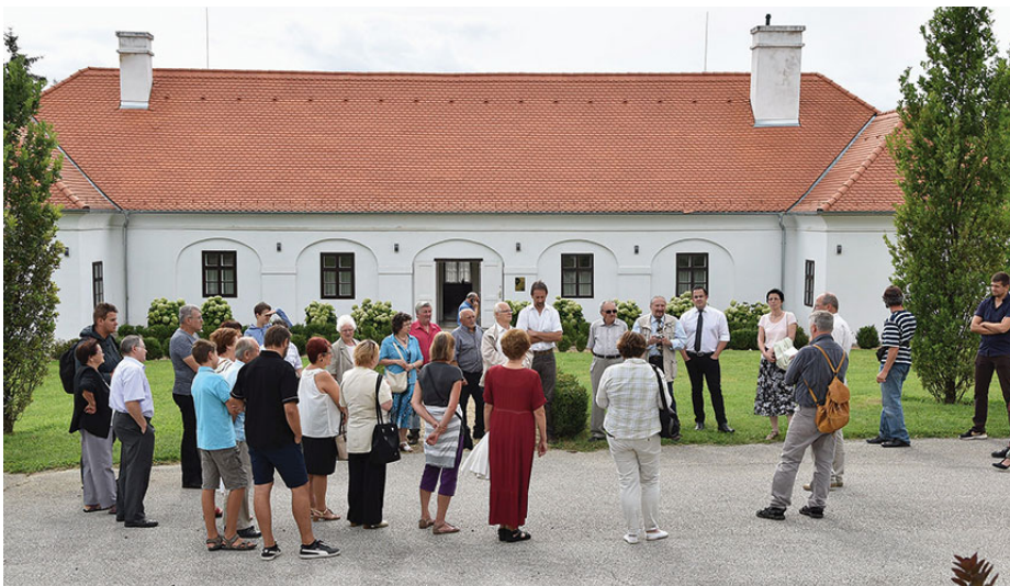
A séta résztvevői a Békeház kertjében