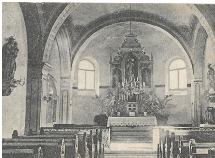
A zárdáépület egykori kápolnája

tolikus leánynevelés céljaira (a püspök idős korában sokat tartózkodott Vasváron, róla kapta nevét a mai Alkotmány utca ezen szakasza, amelyet régebben Szenczy utcának hívtak). A letelepedés után megvásárolták a szomszédos telkeket is, ahol előbb egy kisebb, majd 1912-ben egy nagyobb, emeletes iskolaépületet építettek. Ekkor még az eredeti Szenczy-ház és iskola jól elkülönült egymástól, ahogy azt a régi képeslapokon látni