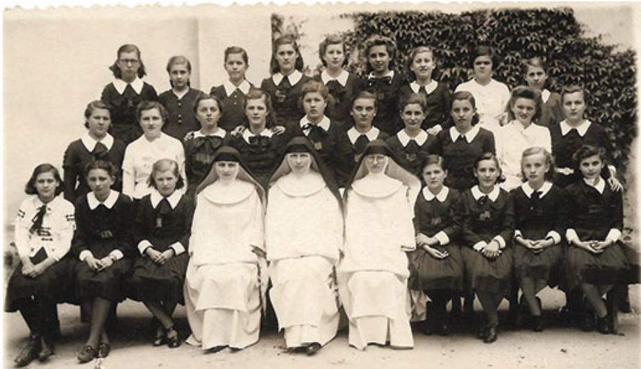
Polgári iskolai osztály az 1940-es évekből

Maga a „zárdá” épülete több részből és több ütembe épült ki. A nővérek eredetileg egy jelentősebb polgárházat kaptak meg, amelyet még Szenczy Ferenc szombathelyi püspök (1852-1869) hagyományozott a ka-