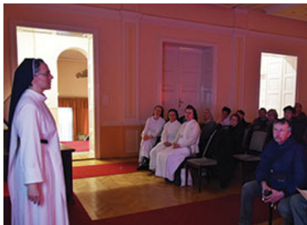
Petra nővér előadása

Március 11-én kissé hűvös időben ugyan, de sor került az első tavaszi városnéző sétára: az érdeklődők a város történetében fontos szerepet játszó zárdá- és iskolaépületet nézhették meg kívül-belül. A sétára Kőszegről és Szombathelyről érkezett domonkos nővérek is elkísérték bennünket.