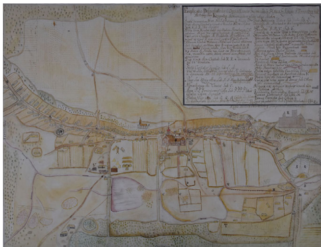
Vasvár látképe az 1740-es évekből

Zágorhidi Czigány Balázs tanulmánya (Vasi Honismereti és Helytörténeti Közlemények 2000/2. 33-39.o.) ugyanott olvasható a könyvtárban: https://library.hungaricana.hu/hu/view/VASM_Vhk_2000/?pg=137&layout=s