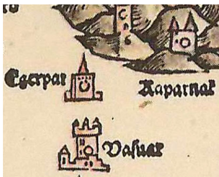
Vasvár Lázár deák 1528. évi térképén

Ferreum) vagy német (Eisenburg) neve, hasonló térképjellek kíséretében. Az egyetlen kivétel mind ez ideig egy 1594-ben készült kéziratban haditérkép a Dunántúl erődített helyeiről, amelyen a Vasvár (Waschwar) felirat