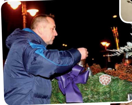
Laki László fotógalériája a vasvar.hu oldalon tekinthető meg