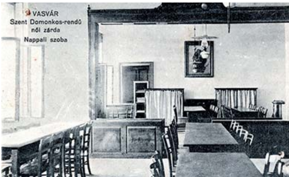
A nappali szoba újonnan előkerült képe

sősorban udvari felvételek tartoztak, a másik pedig az 1920-as évek elején, amelyben több belső kép is megtalálható volt. Eddig egy hálóterem és az ebédlő képét ismertük, a közelmúltban azonban egy internetes aukción feltűnt egy „nappali szoba” (leginkább tanulószoba)