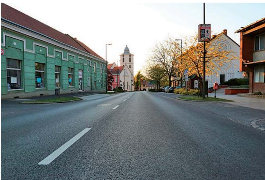
Vasvári utcakép a karantén idején

– Jó érzés volt látni, érezni a vasvári összefogást. Hamar nyilvánvalóvá vált, hogy ami békeidőben elérhető, az vírushelyzetben elérhetetlenné válik. A legfontosabb védőeszközöket, maszkot, védőkesztyűt nem lehetett a hivatalos csatornákon beszerezni, s bizony az első napokban alternatív megoldásokra is szükség volt, hogy a legfontosabb