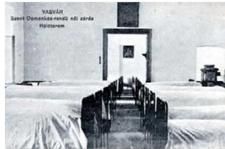
A zárdaiskola hálóterme