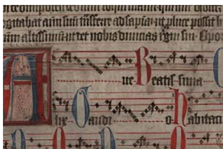
A kódextöredék borítólapjának díszes szövege és gregorián kottája

A „Városnéző séták” tavaly évvégi rendezvényén csak vetített képeken tudtuk bemutatni azt a kódextöredéket, amely a Domonkos Rendtörténeti Gyűjtemény egyik legértékesebb szerzeménye volt az elmúlt években. A két különböző dokumentumból összeállított tíz lapnyi füzet felkeltette a kutatók érdeklődését, ezért