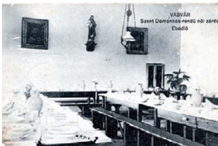
A zárdaiskola ebédlője

A zárdaiskoláról két sorozat képeslap is készült a 20. század első felében: az egyik még az 1910-es években, amelyhez az iskolaépület külső és a zárdakaporna belső képei mellett el-