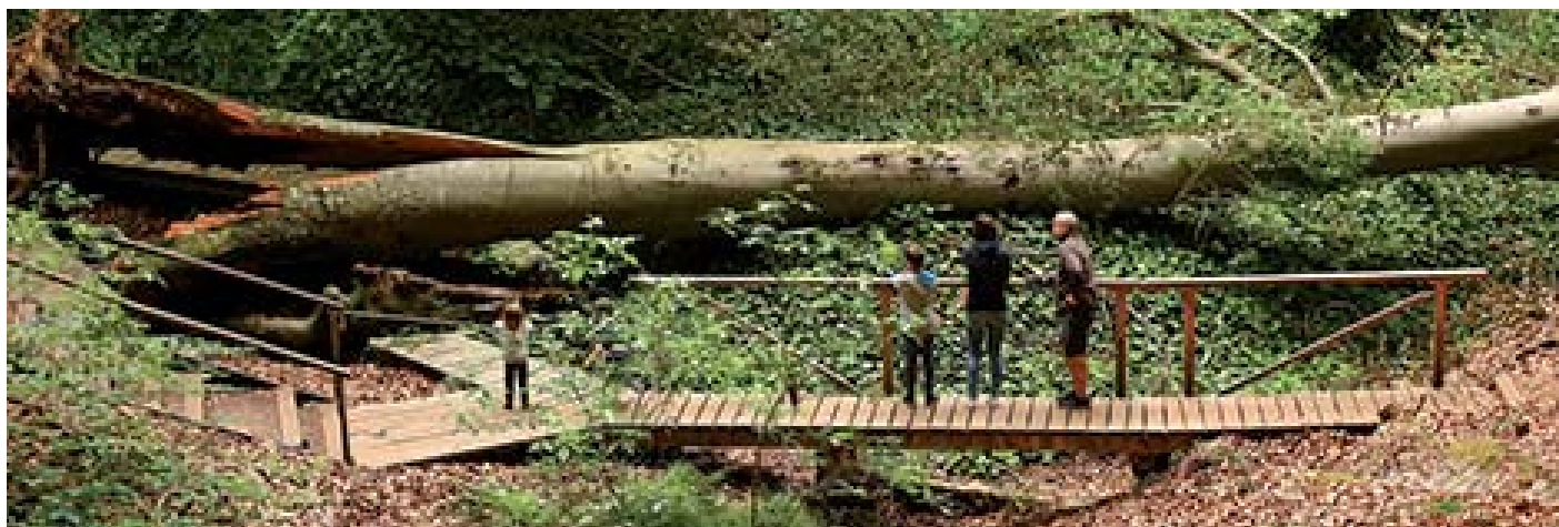
Az ebben az időszakban kidőlt Ambrózy-bükk