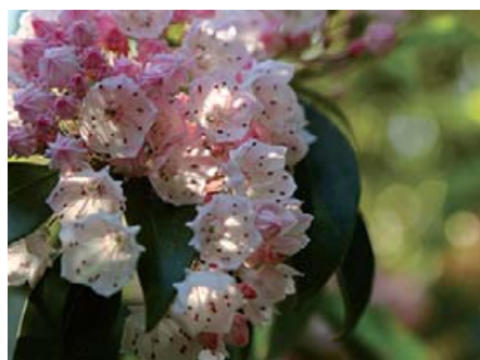
Hegyi babér (Kalnia)