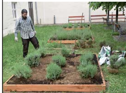
A kolostorkertben új levendulaágyások készültek

A múzeumban nem állt meg az élet a karantén alatt: befejezéséhez közelednek a tetőtéri építkezések, nagy rendrakás folyt a raktárakban, elkészült egy pályázat a „Városnéző séták” anyagának megjelentetéséhez, és még arra is volt idő, hogy egy kicsit csinosítsuk a kolostorkertet. Nézz meg képes beszámolónkat a múzeum honlapján: www.vasvarimuzeum.hu