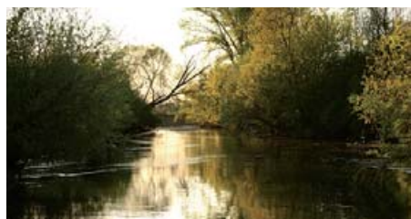
Laki László képgalériája a vasvar.hu oldalon.