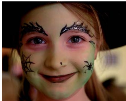
Laki László képgalériája a vasvar.hu oldalon

A szelektív hulladékot 2020. március 18-án, szerdán szállítják el.