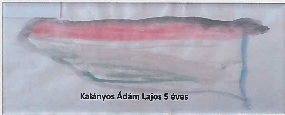
Kalányos Ádám Lajos 5 éves