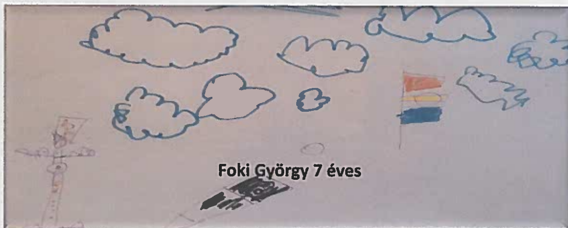
Foki György 7 éves

Szeretettel meghívjuk a Vasvári Játékszín rendhagyó ünnepi rendezvényére! Induljunk és emlékezzünk közösen!