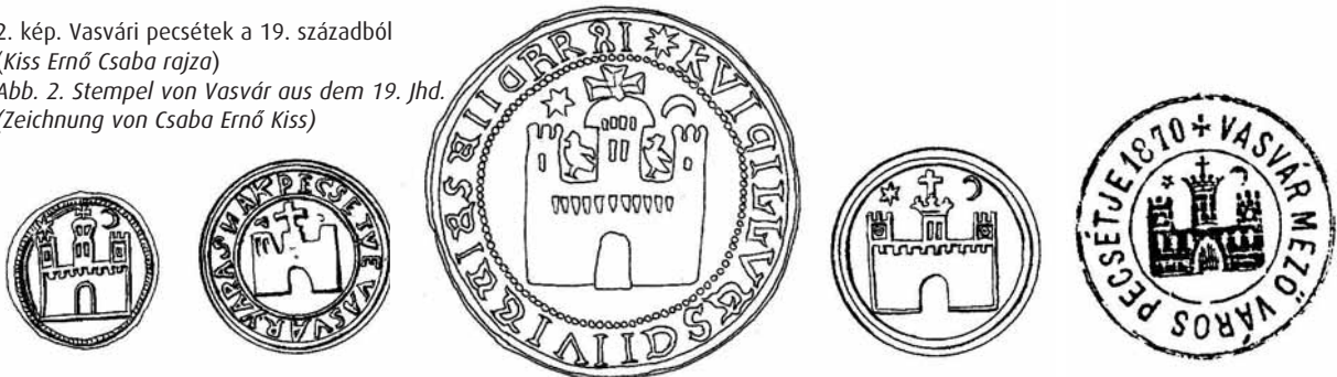
Abb. 2. Stempel von Vasvár aus dem 19. Jhd. (Zeichnung von Csaba Ernő Kiss)

2. kép. Vasvári pecsétek a 19. századból (Kiss Ernő Csaba rajza)