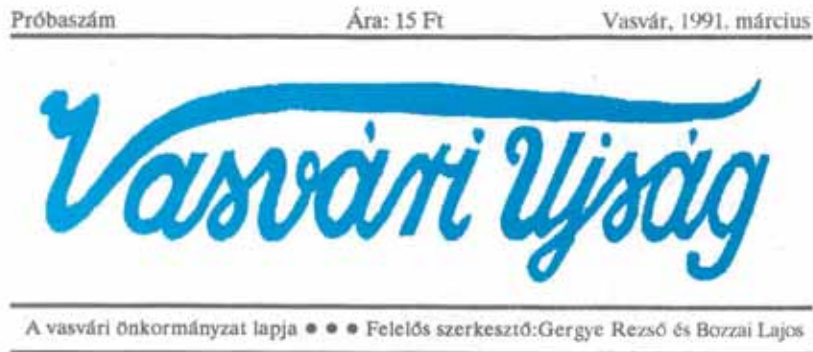
21. kép. A Vasvári Újság próbaszámának fejléce (1991) Abb. 21. Kopfzeile der Probeausgabe der Vasvárer Zeitung (1991)

A címeralkotás nehézségeit azonban jól jellemzi az a folyamat, melynek eredményeként a ma használatos címer létrejött. Először a városi képviselő-testület rövid vita után megalkotta a címer használatáról szóló határozatát, amely lényegében a korábbi „szocialista” címer