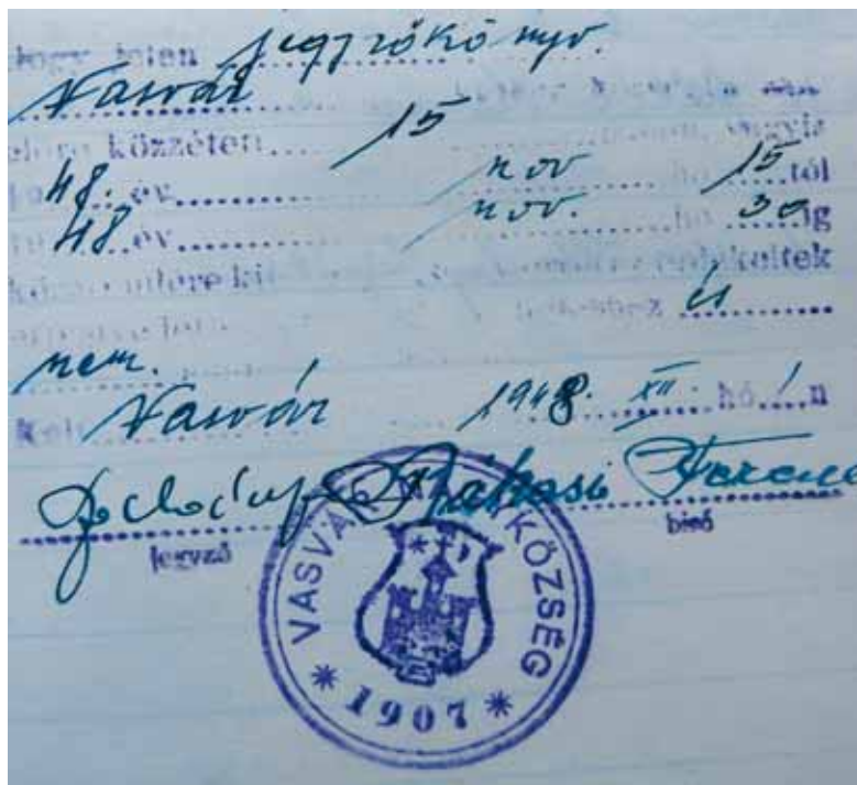
13. kép. Vasvár nagyközség pecsétje (1947) Abb. 13. Stempel der Großgemeinde Vasvár (1947)

címerterven és a Virág-féle ábrázoláson egyaránt tetővel fedett toronyot láthatunk. Ez leginkább arra utalhat, hogy a változtatás oka a közismert városi – akár a közeli szombathelyi és kőszegi, akár a széles körben ismert budai, pesti, fehárvári stb. – címerek egységesítő hatása lehet (ezeken a városi címereken mindenütt fedett tornyokat látunk). Kevésbé feltűnő, de mégis jellegzetes eleme az ábrázolásnak, hogy a vártornyok a korábbi ábrázolásokkal ellentétben nem egy ormozott várfal mögül emelkednek ki, hanem a tornyok a fallal és a kapuzattal mintegy egységes épületet alkotnak. 13 Az már csak heraldikai részletkérdés (de hosszú távon ugyancsak jellegzetes sajátosság), hogy a pajzsban a vár nem mint „lebegő”, hanem mint „emelkedő” címerkép jelenik meg. Ezek a jellegzetességek érvényesek az 1925. évi díszpolgári oklevél címerábrázolására is, ami felveti annak lehetőségét, hogy közös – ma már ismeretlen – minta alapján készültek, vagy hogy az előbbi is Virág