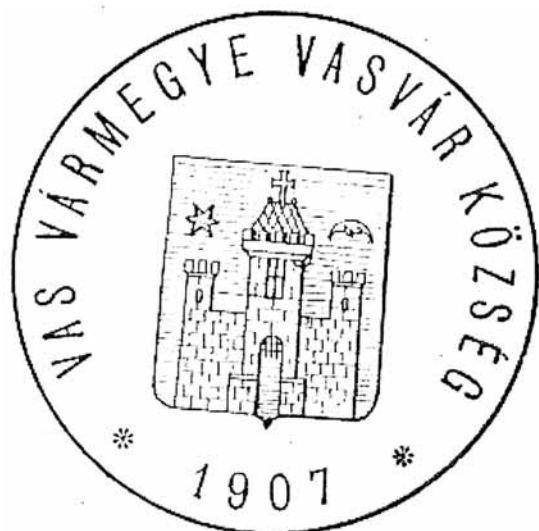
4. kép. Vasvár pecsétterve az Országos Törzskönyvbizottságtól (1907)

Abb. 4. Stempelplan von Vasvár von dem Nationalen Stammesbuchkomitee (1907)