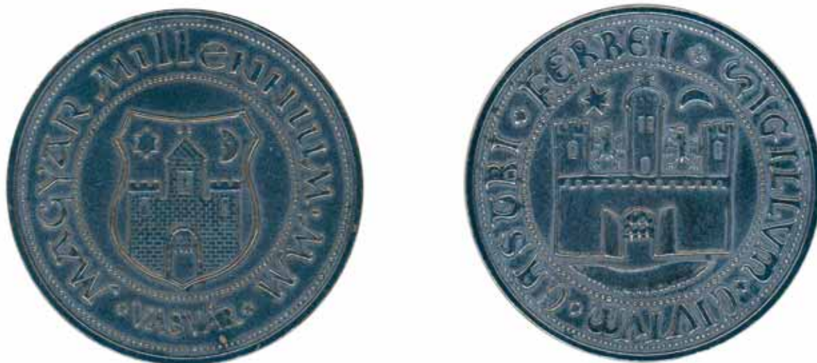
23. kép. Vasvár város mai címere és középkori pecsétnyomója a millenniumi emlékérmén (2000)

Abb. 23. Mittelalterlicher Stempel der Stadt Vasvár und der heutige Wappen auf der Gedenkmünze zum Millennium