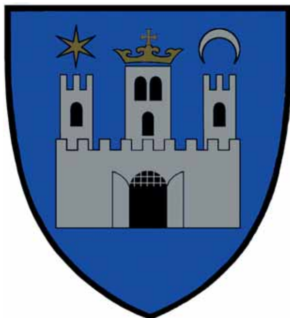
25. kép. Címerterv Vasvár történelmi címerének megújítására (2010) (A szerző rajza) Abb. 25. Wappenplan für die Erneuerung des historischen Wappens von Vasvár (2010) (Zeichnung des Autors)

A javasolt címer leírása a következő: háromszögű pajzs kék mezejében ezüst színű, három tornyú vár lebeg, a vár ormózott falán kitárt kapuszárnyakkal és felhúzott csapórácscsal kapu nyílik; a várfal mögött jobb és bal oldalon egy-egy kisebb ormózott, egy ablakos torony, középen egy nagyobb, két szintes, alul egyablakos, felül ikerablakos