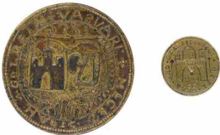
3. kép. Vasvári céhpecsétek városi címerképpel (XVIII–XIX. sz.) Abb. 3. Zunftstempel aus Vasvár mit dem Wappenbild der Stadt (XVIII–XIX. Jhd)

vizsgálata során azonban nyilvánvalóvá vált, hogy a középkori pecsétnyomattól függetlenül is tovább élt az eredeti címer- és pecsétkép hagyománya. Már a 18. század elejéről fennmaradt egy (feltehetően még korábbi eredetű) háromtornyú várat ábrázoló, kisebb méretű pecsét lenyomata Vasvárról, a XIX. századból pedig több változata is ismert ennek a pecsétképnek a hármastelepülés közös, majd pedig Vasvár mezőváros, illetve Zsidó-földe község pecsétjein (2. kép). (ZÁGORHIDI CZIGÁNY 1994.)