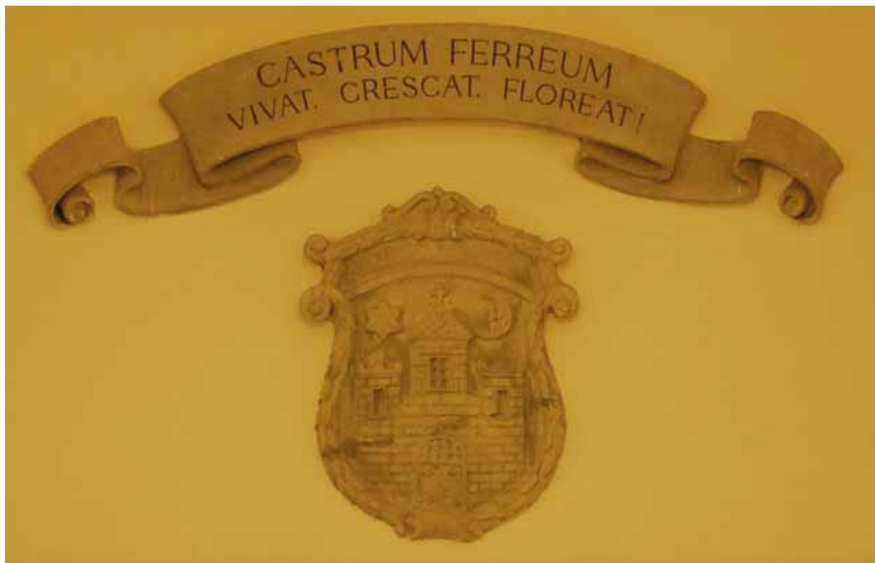
9. kép. Vasvár címere a városháza lépcsőházában (1929) Abb. 9. Wappen von Vasvár in dem Treppenhaus des Bürgermeisteramtes (1929)