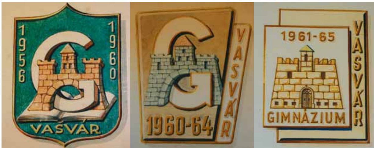
17. kép. Iskolajelvények a gimnázium tablóról (1960–1965) Abb. 17. Schulabzeichen auf den Gymnasialfotos (1960–1965)

Ez a szép ábrázolás akár arra is alkalmas lehetett volna, hogy a későbbi címermegújításokhoz mintát adjon, de az utókor figyelmét sajnos elkerülte. Pedig a jelvény hosszú éveken keresztül használatban volt, és életszerű