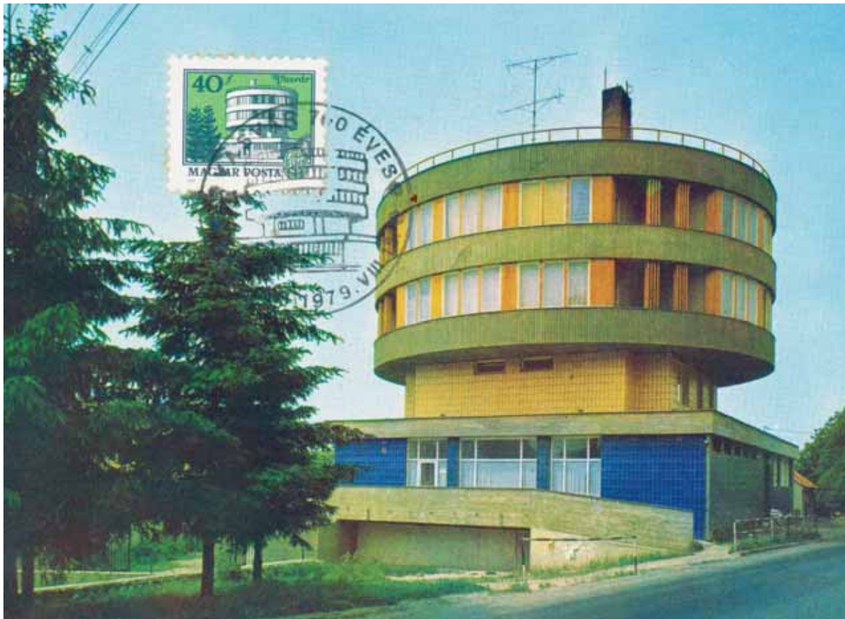
18. kép. Képeslap, bélyeg és elsőnap bélyegző a Körház képével (1979) Abb. 18. Postkarte, Stempel und Rundstempel am ersten Tag mit dem Bild des Rundhauses (1979)

alkalmazására jó példa, hogy az érettségi tablókön számtalan – ötletes és igényes kivitelű – variánsa is megjelent a 60-as években, de a különböző iskolai kiadványokon, diákújságokon egészen az 1970-es évek