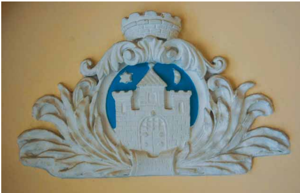
11. kép. Vasvár címere a városháza bejáratánál (1929)

Abb. 11. Wappen von Vasvár bei dem Eingang des Bürgermeisteramtes (1929)