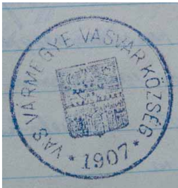
5. kép. Vasvár nagyközség pecsétje (1907)

Abb. 5. Stempel der Großgemeinde Vasvár (1907)