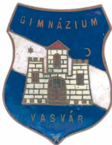
16. kép. Sapkajelvény a gimnáziumból (1960 körül) Abb. 16. Kappenzeichen aus dem Gymnasium (um 1960)

címerpajzs átszerkesztése (harántpólya, lebegő címerkép, felirat) ugyanakkor arra vall, hogy egy jó kezű és némi heraldikai érzéssel megáldott rajztanár gondosan megtervezett munkáját lássuk benne.