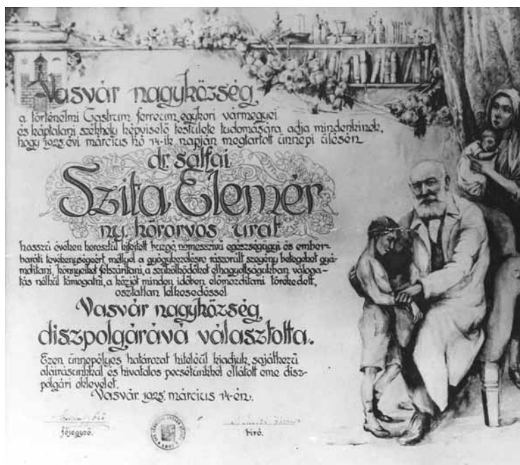
Abb. 6. Ehrenbürgerurkunde von Elemér Szita (1925)