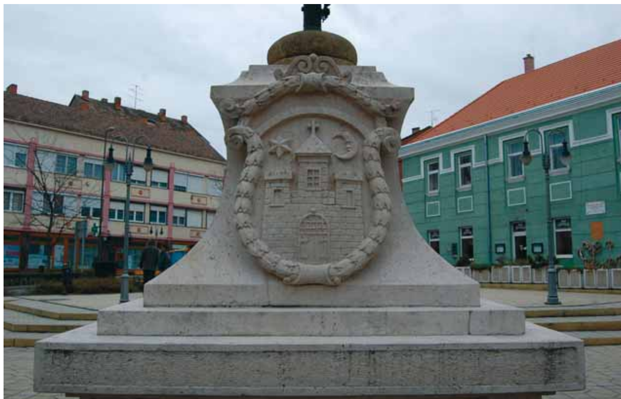
10. kép. Vasvár címere az országzászló talapzatán (1933) Abb. 10. Wappen von Vasvár auf dem Sockel der Landesfahne (1933)