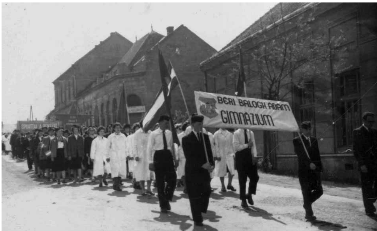
15. kép. Május 1-jei felvonulás Vasváron a gimnázium tanárainak és diákjainak részvételével (1960) Abb. 15. Umzug am 01. Mai in Vasvár unter der Teilnahme der Gymnasiallehrer und Schüler (1960)

látjuk az iskola jelvényét, a diákok pedig olyan sapkát viselnek, amelynek egy példánya, szép sapkajelvényel együtt ma is megtalálható a múzeum gyűjteményében. 20 (15. kép)