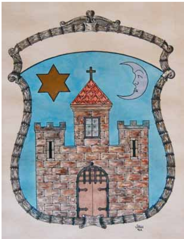
8. kép. Virág Endre címerrajza (1928) Abb. 8. Wappenzeichnung von Endre Virág (1928)

egy nagyobb, a kapu felett pedig egy kisebb kereszt is látható (HALÁSZ 1930, 291). (7. kép)