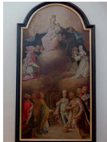
A domonkos rend Szűz Mária védelmező köpenye alatt

mégis munkájuk révén egy tekintélyes rendtartomány született meg, amelynek a középkor végén már közel félszáz kolostora volt. A magyar domonkosoknak számos kevésbé ismert helyi tiszteletnek örvendő tagja – pl. Boldog Buzád bán, Csák Móric, vagy Boldog Ilona – mellett olyan széles körben tisztelt szentje is volt, mint az 1943-ban szentté avatott Árpád-házi Szent Margit. A középkori magyar művelődéstörténet számos kiemelkedő darabja – kezdve az Ómagyar Mária-siralomtól a margitszigeti magyaryelvű kódexekig – köthető a rendhez, műemlékeink közül pedig olyan jelentős épületmaradványok, mint a budai Szent Miklós-kolostor (a mai Hilton Szálló épületében) és a margitszigeti romok. Ezt a virágzó rendtartományt a 16. században a török hódítás és a reformáció terjedése pusztította el szinte nyomtalanul. A 17. században újjá szerveződő rend már nem érte el régi nagyságát, de főleg a Nyugat-Dunántúlon – soproni, szombathelyi és vasvári kolostoraival – jelentős lelkipásztori munkát végzett egészen 1950-ig, amikor a kommunista rendszer erőszakkal számolta fel a hazai szerzetesrendek működését.