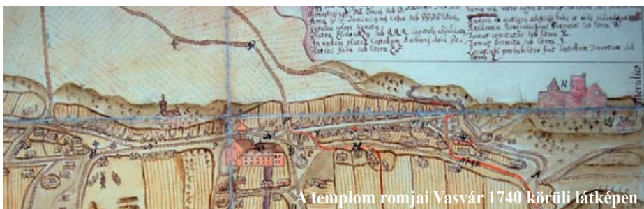
A templom romjai Vasvár 1740 körüli látképen

A templom ebben a formájában a 12-13. század során épülhetett ki, de ezt megelőzően egy korábbi, kisebb méretű egyházi épület is állhatott itt, erről azonban csak feltételezéseink vannak (ez lehetett az államalapításkori vár ún. váralja településének plébániája). A jelentős építmény kialakítására a vasvári káptalan megalapítása adhatott alkalmat. Ez az egyházi intézmény egy olyan papi testület volt, amely fontosabb központokban jött létre és többnyire fontos papi vezetők munkáját segítette; ilyen vezető volt a vasvári főesperes, aki az annak idején még a győri püspökséghez tartozó Vas vármegye egyházi ügyeit irányította. A káptalan fontos világi