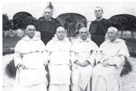
A vasvári domonkos atyák és segítő testvérek 1929-ben

A második világháború után Magyarországon berendezkedő kommunista rendszer erős nyomás alatt tartotta a Magyar Katolikus Egyházat és általában a felekezeteket, melynek végső célja az egyházi társadalmi befolyásának visszaszorítása, az egyházi intézmények tevékenységének korlátozása és a vallásgyakorlás ellehetetlenítése volt. A folyamat az egyházi egyesületek felszámolásával kezdődött, majd a felekezeti iskolák 1948. évi államosításával folytatódott, végül a Mindszenty József bíboros elleni kirakatperben csúcsozott ki. Mindez azonban még nem volt elegendő a katolikusok megtöréséhez, a végső megoldást és az állam és az egyház közötti megállapodás kikényszerítését a rezsim a szerzetesrendek működési engedélyének megvonásával, több ezer apáca és szerzetes internálásával és a rendházak vagyonának államosításával érte el a rezsim. Hetven évvel ezelőtt, 1950-ben hur-