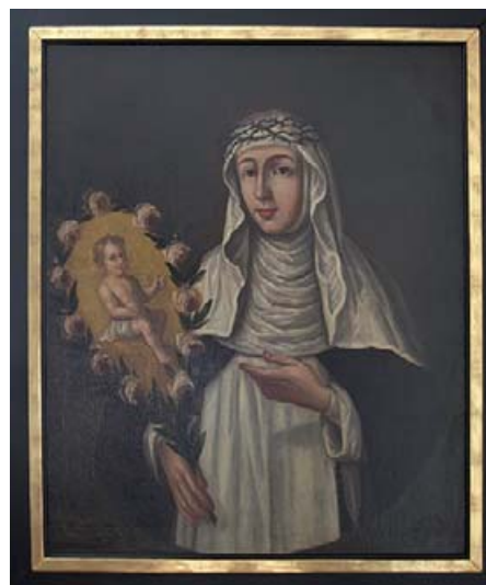
Limai Szent Róza

taurálása. A közelmúltban újult meg Limai Szent Róza 17. század végéről származó olajfestménye is, amelyet október 18-án láthattak Vasváron az érdeklődők. Szent Róza, domonkos harmadrendi szerzetes a 16-17. század fordulóján élt, ő lett Dél-Amerika első kanonizált szentje, de nem csak az Újvilágban, hanem Európában is tisztelték. Képe – amelyet a fején viselt vagy a kezében tartott rózsakoszorúról lehet felismerni – ott látható a vasvári templom mennyezetképein is.