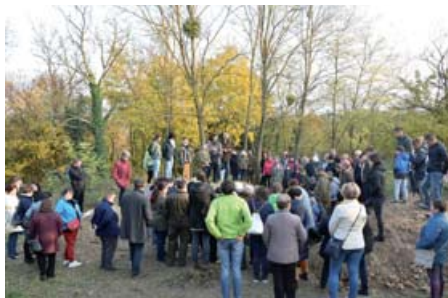
Az ásatás kezdete a kettőskereszt tövében

A „Városnéző séták” minden eddigi rendezvényét felülmúló érdeklődés mellett zajlott november 7-én, vasárnap délután az ásatások helyszínét és eredményeit bemutató séta. Sokan a vasváriak közül is csak most jártak először a Szent Mihály-dombon, és rácsodálkoztak a hely különleges hangulatára, a dombtetőről nyíló nagyszerű kilátásra.