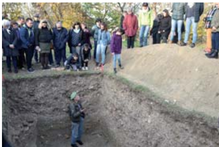
A gödör mélyén

A mintegy száz érdeklődő valóságos körmenetben vonult fel a buszpályaudvarról a szőlőhegyre, utoljára ennyi ember valamikor a középkorban kereshette fel a szent helyet, talán éppen egy Szent Mihály-napi búcsú alkalmával! A nagy érdeklődés bizonyára a ma is egyik legnépszerűbb tudománynak, a régészetnek szólt, de sokakat készíthetett a sétára – a szép őszi idő mellett – a városunk múltja iránti érdeklődés is. Az egykori káptalani templom ugyanis Vasvár történetének egyik legfontosabb helyszíne: nem csak egy papi testület élt és imádkozott itt valamikor, hanem egyúttal ők voltak Vasvár és a környék egyik legjelentősebb birtokosai, akik egyúttal egy olyan fontos intézményt vezettek, ahol az évszázadok során okiratok ezreit állították ki és őrizték meg.