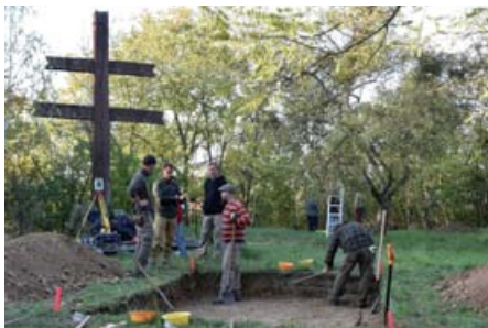
A régészet az érdeklődők gyűrűjében