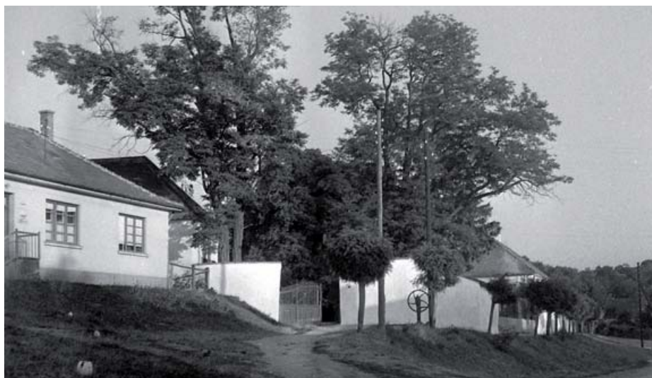
A Tretter-ház és az Ezredes-ház bejárata az 1950-es években