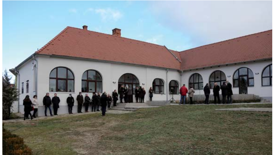
A város legújabb fejlesztése az Ezredesház felújítása

– A szivattyú tönkrement, amit ki kellett cserélni. De az évek alatt annyi lerakódás jelent meg a csövekben, hogy a szivattyú kiemelés közben megszorult és bennszakadt. Egy nagyon nehéz, bonyolult műszaki mentési műveletet kellett megvalósítani. Az első technikai próbálkozás nem sikerült, a második már igen. Kétezer méter mélyről