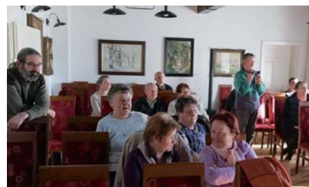
A filmvetítés közönsége