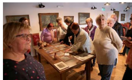
Búcsúi emlékek bemutatása

Az április 10-i „Nézzük meg együtt” program témája az 1977-ben bemutatott „Veri az ördög a feleségét” c. játékfilm volt, amely több, hosszabb-rövidebb eredeti felvételt is tartalmaz Vasvárról, többnyire a szeptemberi Mária-búcsúról. A filmhez