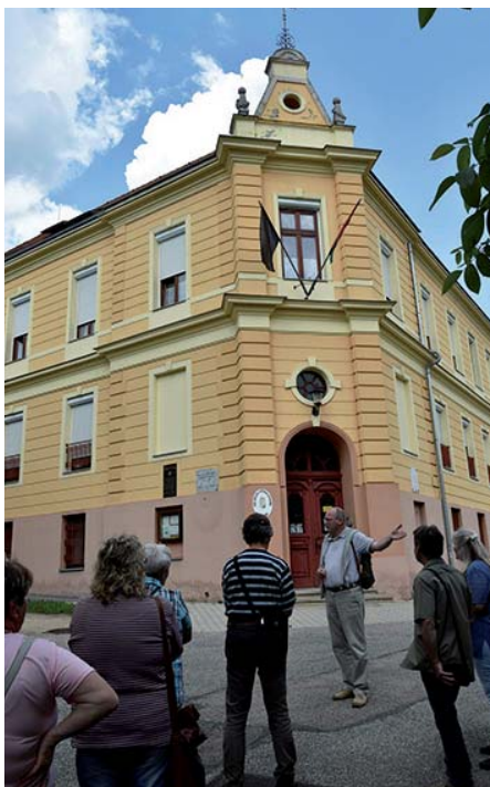
Gyülekezés az egykori iskolaépület előtt