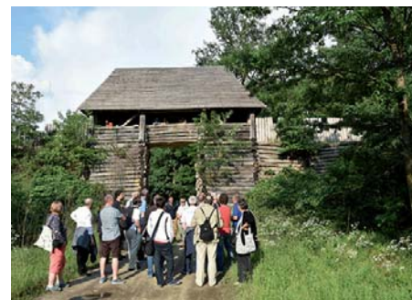
A szakmai kirándulás résztvevői a Vasvári sánctól

borkóstolóval, fogadással és éjszakai múzeumlátogatással ért véget a kolostorban.