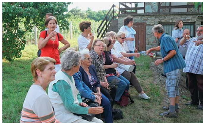
Pihenő a szőlőhegyen