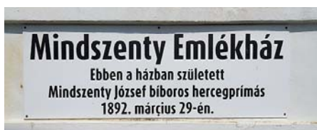
A Mindszenty Emlékház táblája

A városnéző séta júliusi programjában egy kicsit kitekintettünk a térségre: a Hegyhát legismertebb történelmi személyisége, Mindszenty József esztergomi érsek szülőfaluját néztük meg. Örömmel láttuk – mind az emlékháznál mind pedig a templomban – az igényesen kialakított emlékhelyeket, sőt a rendezett falukép arról is meggyőzhet bárkit is, hogy nemcsak elszigetelt presztízsbetűházakról van szó. Csehimindszent valóban azon dolgozik, hogy igazi egyházi-történelmi emlékhelyé váljon.