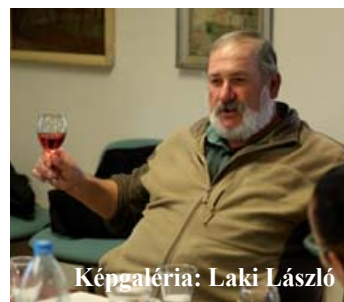
Képgaléria: Laki László