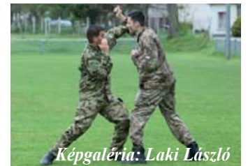
Képgaléria: Laki László