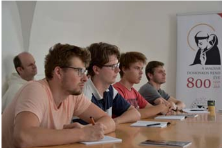
Előadás a kolostorban

A domonkos jubileum adott alkalmat arra, hogy az idei évben egy régóta tervezett program induljon újtára a vasvári domonkos kolostorban: fiatalok számára szóló nyári egyetem jellegű képzés a domonkos rendről és általában a szerzetességről. Mintegy tíz fiatal jött össze három napra az ország különböző részeiről, sőt a határokon túlról is. Az előadásokat domonkos atyák és nővérek tartották, de szót kaptak a renchez kötődő