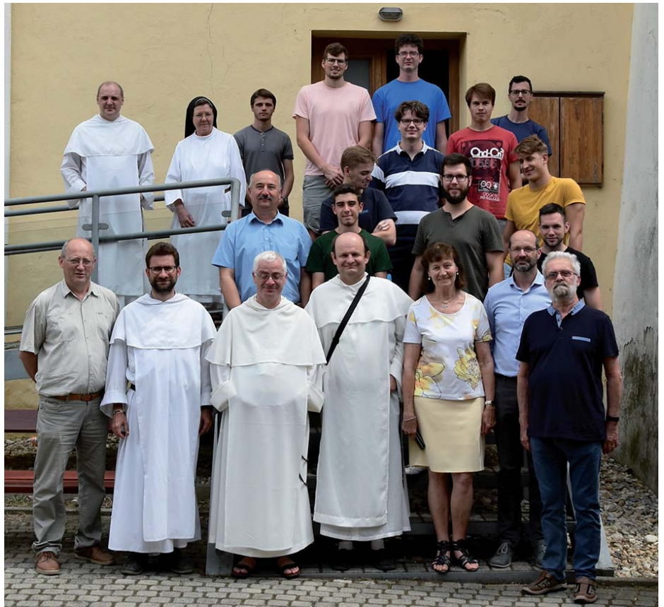
A nyári egyetem előadói és hallgatói

világi szakemberek is. A témák a rend karizmája, lelkiisége és történelme köré összpontosultak, ugyanakkor szóba kerültek napjaink keresztény kérdései: a teremtésvédelem, az alternatív gazdasági modellek és a hívő alkotók felelőssége. Ez utóbbi témakörben a hegyháti kötődésű Nagy Gáspár életművét mutatták be, és a résztvevők fel is keresték a költő szülőfaluját és sírját, Bértaváron illetve Nagytillajban. Az előadások egy része nyilvános volt, így a vasváriak is bekap-