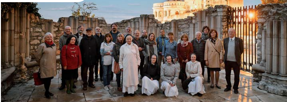
A konferencia résztvevőinek egy csoportja a budai Hilton Szálló Dominikánus-udvarán

Előadások hangzottak el a rend hazai történetéről és emlékganyagáról, a koldulórendi (ferences és domonkos) építészeti középkori kezdeteiről, a margitszigeti, kolozsvári és a vasvári kolostorok kutatásáról, a barokk domonkos templomok művészetéről, valamint