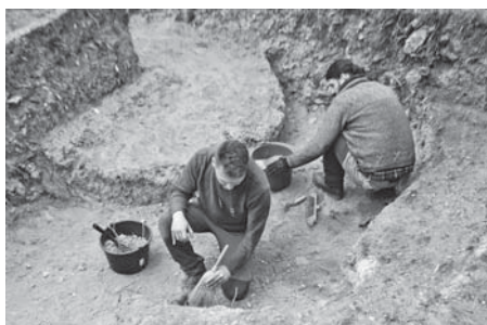
Az északi mellékszentély ívének kibontása

A Szent Mihály-dombi ásások tervezett befejezése után november 6-án „Városnéző séta” keretében mutatták be az idei ásási évad eredményeit a Szent Mihály-dombon. A nagy érdeklődésre való tekintettel egy héttel később, november 13-án is meg kellett ismételni a bemutatót. De a munkálatok sem értek véget, lapzártá után, december első napjaiban, már eléggé barátságosan időjárási viszonyok között bontották ki a régészek az utolsó sírokat.