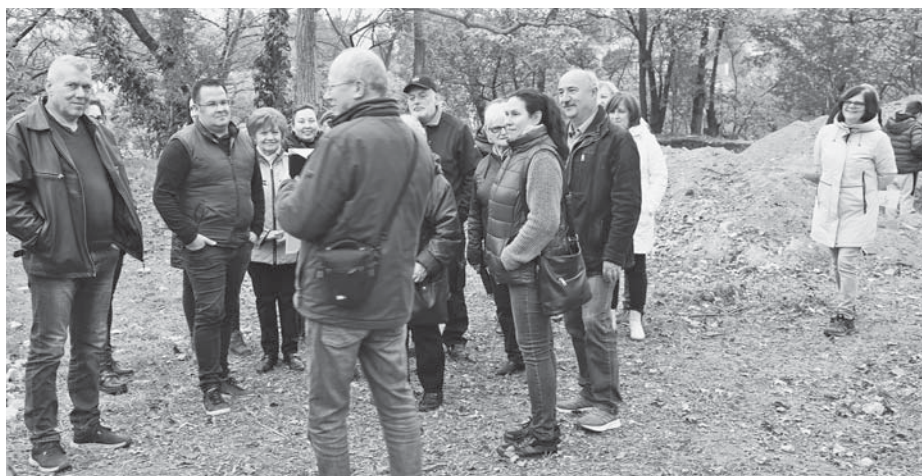
A november 6-i séta résztvevői az ásási területen