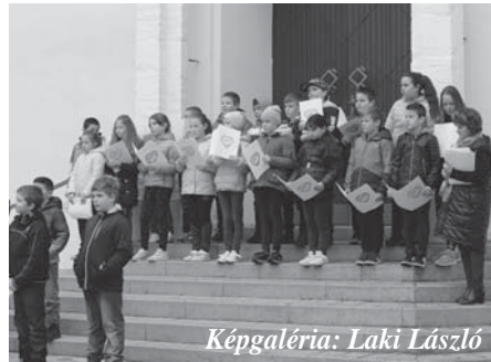
Képgaléria: Laki László