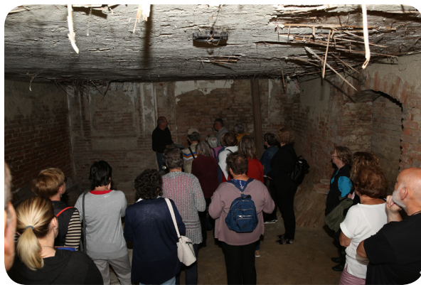
1. kép: Városnéző séta a föld alatt

A refraktórium a kolostorok nagyméretű és többnyire gazdagon díszített közösségi terme, ahol a szerzetesek a közös étkezésekre gyűltek össze. A testi és szellemi táplálkozás jelképes összekapcsolódását volt hivatva jelezni a felolvasás: míg a szerzetesek csendben ettek, egy testvér hangosan felolvastott a regulából, a szentek életéből vagy valami más lelki olvasmányból. A legszebb középkori magyar refraktórium éppen egy domonkos kolostorban, a kolozsvári – a ma ferencesek által használt – rendházban maradt fenn, a leglátványosabb barokk tér pedig a pannonhalmi bencéseknel látható.