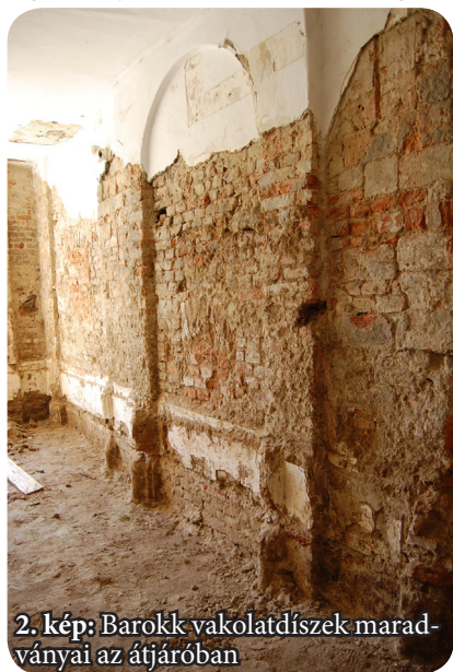
2. kép: Barokk vakolatdíszek maradványai az átjáróban

Egykor a vasvári kolostorban is volt refraktórium, a középkori terem még feltárássra vár, de a barokk étkezőből látványos részletek maradtak fenn. A török korban romba dőlő épület helyreállítása a 18. század végén fejeződött be, ekkor épült fel a délkeleti sarkon egy közel száz négyzetméter alapterületű és két emelet magasságú boltozott tér (ennek helyét jelzik a zeneiskola tanári szobái alatt ma is látható nagyméretű ablakok), mellette konyhával (ez utóbbi pedig megegyezik a mai zárandokszállás konyhájával). A refraktórium nem volt sokáig használatban, ugyanis amikor a domonkosok a 19. század közepén ezt az épületrészt bérbe adták különböző állami hivataloknak, az egykori tágas teret egy fa födémmel két szintre és több kisebb helyiségre osztották. A 20. században tovább pusztult: amikor 1929-ben felépült a főtéri szárny emeleti szintje (a mai zeneiskola), a terem utolsó traktusát elbontották és helyén egy tágas lépcsőházat alakítottak ki.