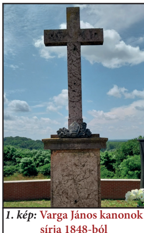
1. kép: Varga János kanonok sírja 1848-ból

Az elmúlt havi városnéző sétánk során a temető legrégebbi síremlékeit néztük meg. Ennek kapcsán merült fel az ötlet, hogy nem elég megismerni városunk történeti emlékeit, hanem tennünk is kellene valamit azok megőrzésért. Újítsuk fel, gondozzuk és ismertessük meg Vasvár értékeit: Tegyük rendbe együtt!