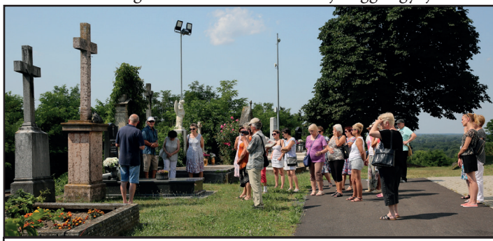
2. kép: A városnéző séta a legrégebbi síremlékek nyomán

Ez az adakozó kedv és a közösségi célok iránti elkötelezettség bizonyára ma is megvan a magyar polgárokban, csak talán kissé nehezebben mozgósítható. Ezért kísérleti jelleggel gyűjtést sze-