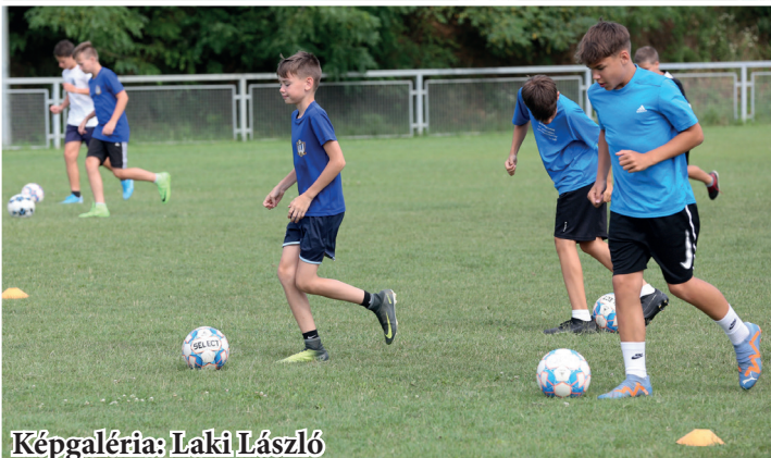
Képgaléria: Laki László