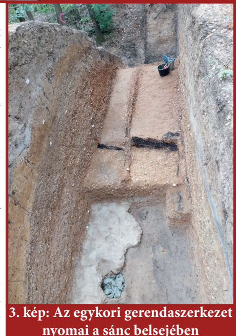
3. kép: Az egykori gerendaszerkezet nyomai a sánc belsejében