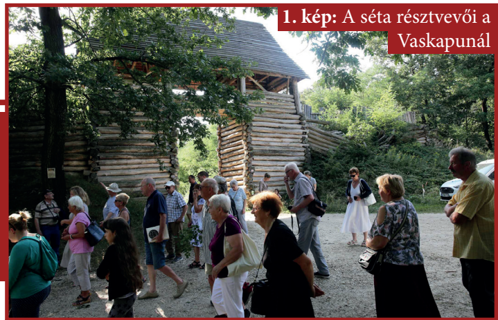
1. kép: A séta résztvevői a Vaskapunál

A Vasvári sánc régészeti feltárása tulajdonképpen egy nagy metszet készítését jelenti, amely magában foglalja az árkot, a töltést és a mögötte futó utat is. A metszet két méter szélességben készült el, így lehetőség van különböző szinteken a felszínt is megfigyelni és dokumentálni. Már a kutatás jelenlegi állásánál is jól megfigyelhető, hogy a töltés több ütemben készült, és magát a földépítményt is fa szerkezettel erősítették meg. Az előkerült famaradványok természettudományos vizsgálatokra is alkalmasak, ezek segítségével fél évszázad pontossággal meghatározható lesz majd a sánc egy-egy korszakának építési ideje. Az eredmények feldolgozása után részletesen is beszámolunk a Vasvári Újság olvasóinak arról, hogy mikor is épült pontosan a sánc és meddig volt használatban.